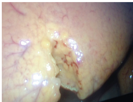
Рис. 1. Лапароскопическая биопсия печени у больного М.

Таким образом, на основании проведенного клинико-лабораторного и молекулярно-генетического обследования поставлен клинический диагноз основной: Дефицит лизосомной кислой липазы. Болезнь